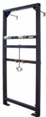
STELAŻ PODTYNKOWY DO UMYWALKI DELFIN A102