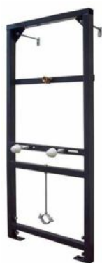
STELAŻ PODTYNKOWY DO PISUARU DELFIN A104