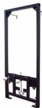
STELAŻ PODTYNKOWY DO BIDETU DELFIN A103