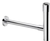
Ozdobny syfon umywalkowy