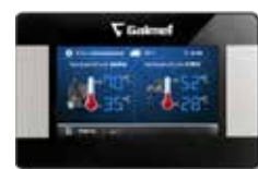
Dotykowy regulator PELLASX S.Control Touch (opcja)