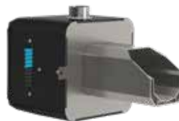
Palnik hybrydowy PELLASX z funkcją automatycznego czyszczenia