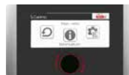
Regulator PELLASX S.Control